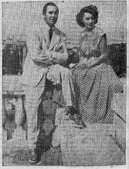
Los artistas de la pantalla Tyrone Power y Linda Christina posan durante una gira por Italia. Ambos se encuentran en Roma

AL MISMO TIEMPO QUE USTED ESTA LEYENDO "EL GRAN DIARIO LA NACION", MILLARES DE PERSONAS EN LAS OTRAS CUATRO REPUBLICAS ESTAN HACIENDO LO MISMO. TENEMOS, AL FIN, UN PERIODICO HECHO POR CENTROAMERICANOS PARA TODA CENTRO-AMERICA